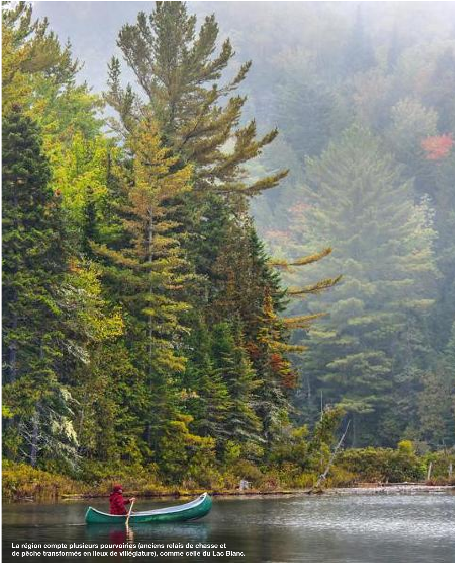
La région compte plusieurs pourvoiries (anciens relais de chasse et de pêche transformés en lieux de villégiature), comme celle du Lac Blanc.