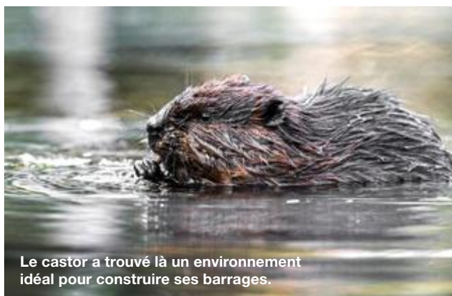
Le castor a trouvé là un environnement idéal pour construire ses barrages.

A 500 mètres d'altitude et à la vitesse modérée de l'hydravion, on a tout loisir d'admirer le bouclier canadien, ses pépites lacustres, ses collines touffues et parfois sa faune