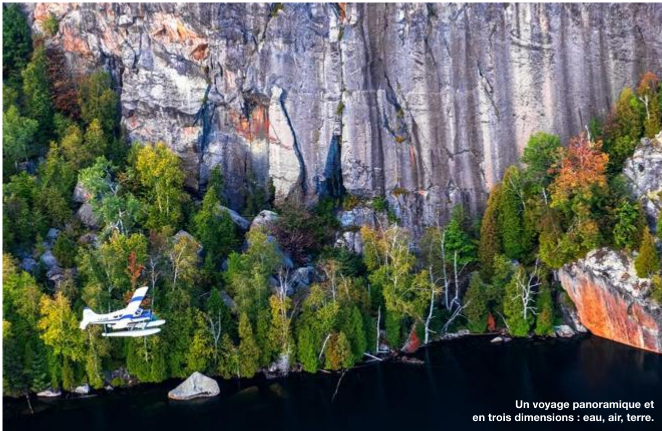
Un voyage panoramique et en trois dimensions : eau, air, terre.