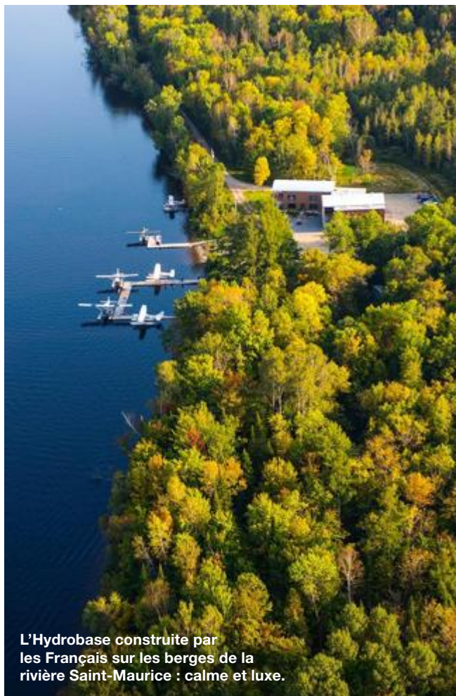
L'Hydrobase construite par les Français sur les berges de la rivière Saint-Maurice : calme et luxe.