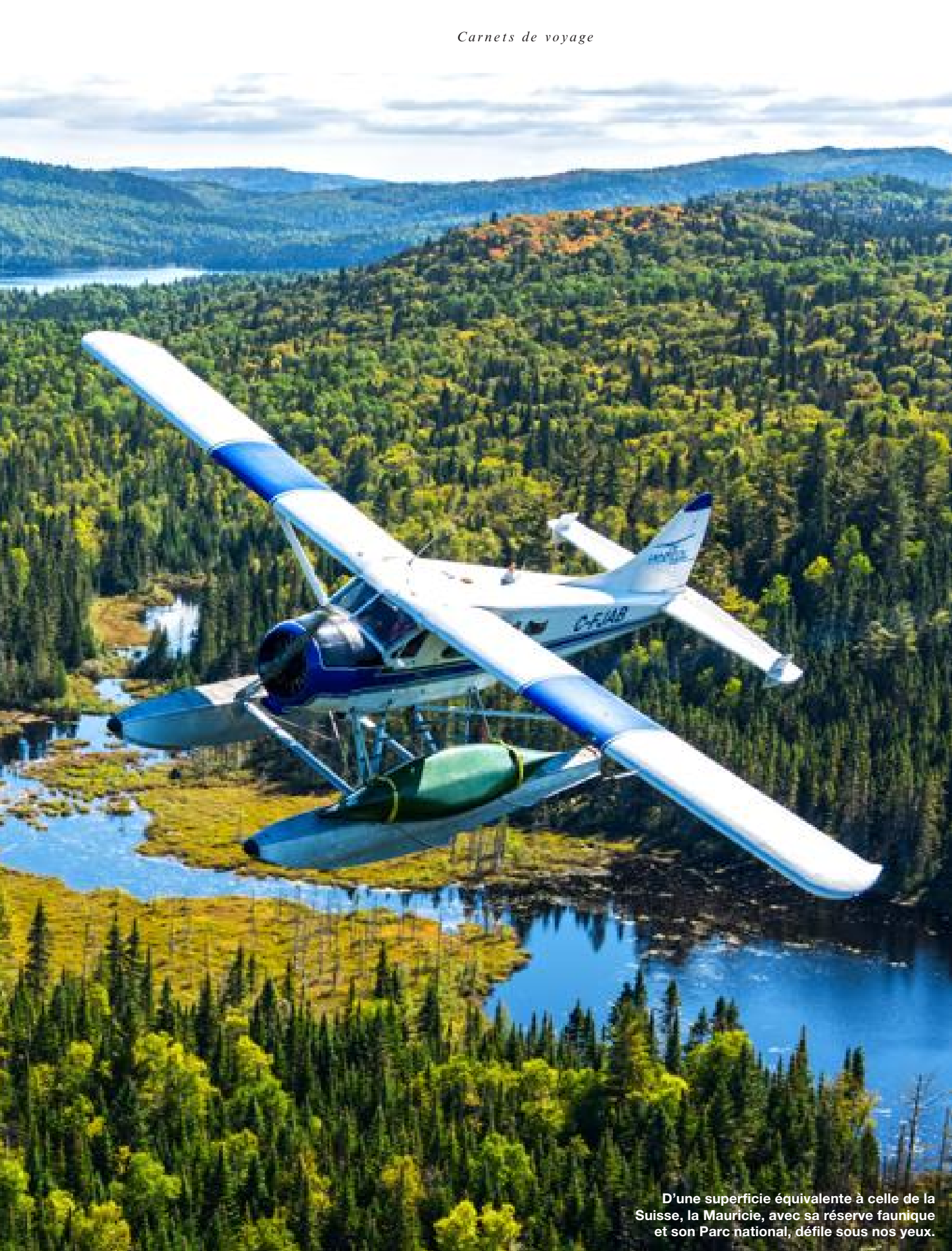
D'une superficie équivalente à celle de la Suisse, la Mauricie, avec sa réserve faunique et son Parc national, défile sous nos yeux.